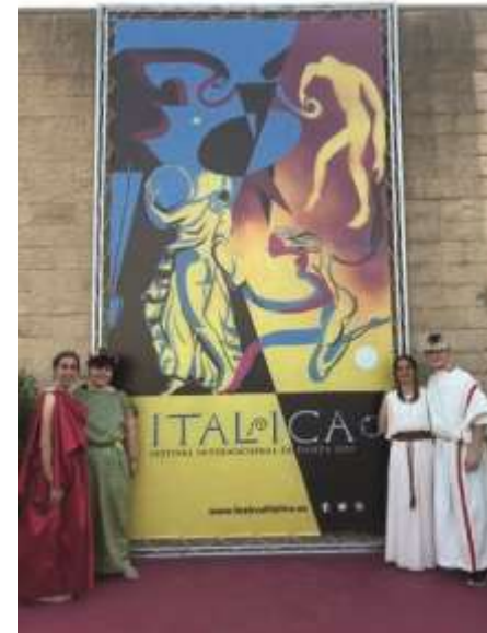
Festival Internacional de Danza