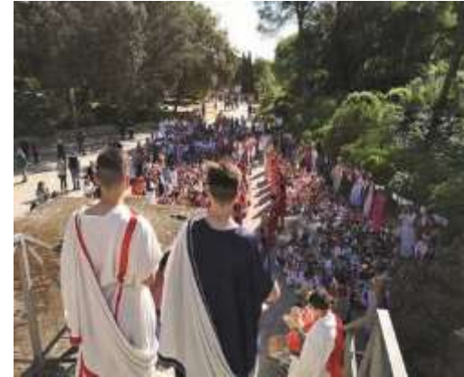
Día de la Romanidad