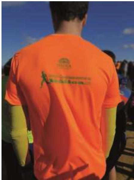
XXXVII Cross Internacional de Itálica