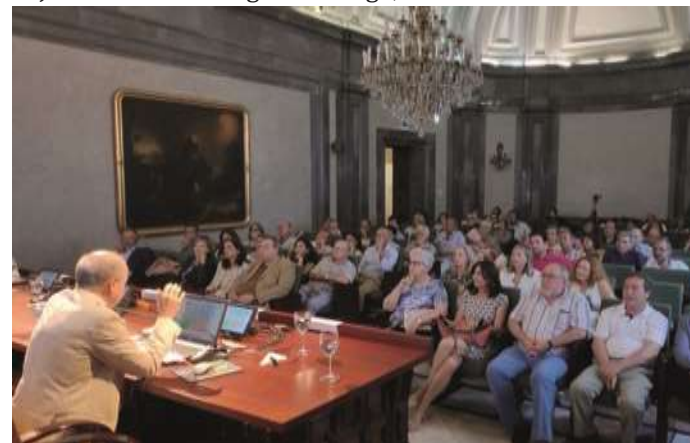
Público en el Salón de la casa de la Provincia.