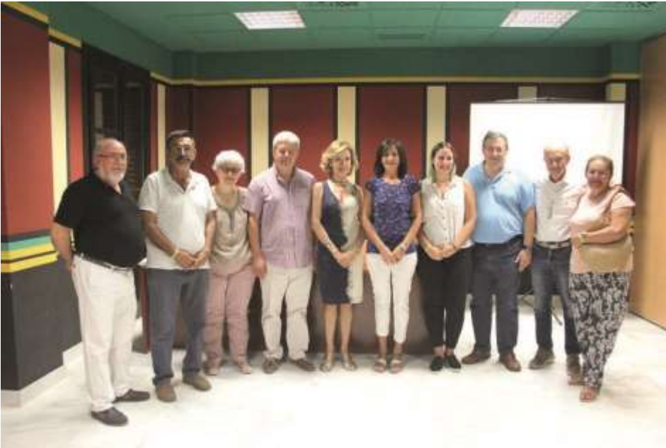
Miembros de la corporación municipal y de asociaciones de Santiponce con el alcalde y los conferenciantes.