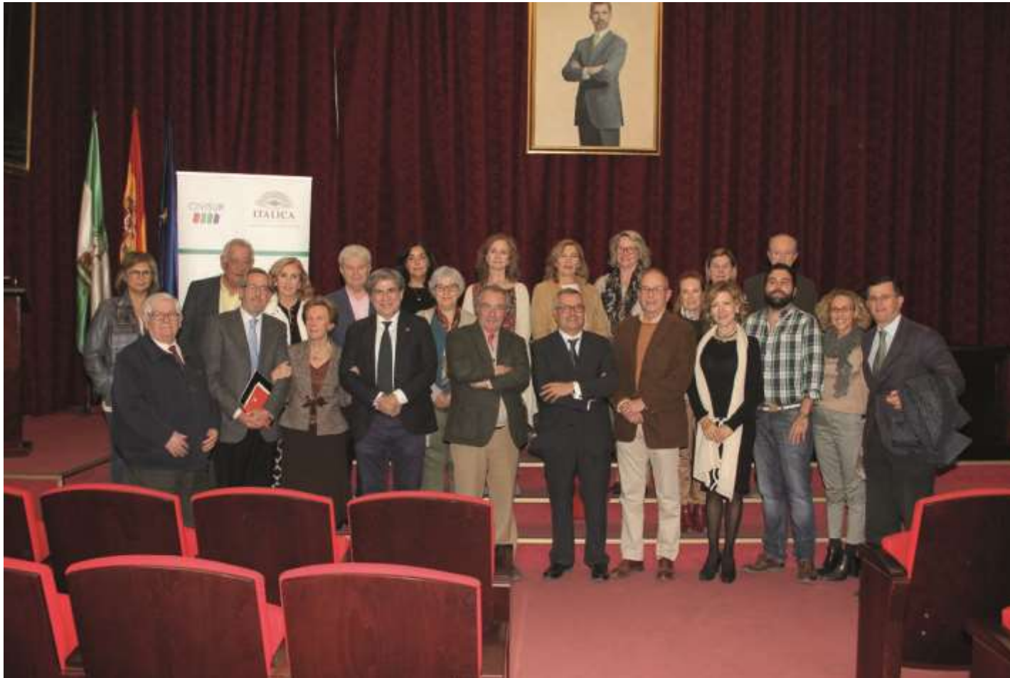
Foto de grupo en la clausura del III Curso del Foro Permanente Itálica, en-clave de Patrimonio Mundial. Paraninfo de la Universidad de Sevilla 6 de noviembre de 2019