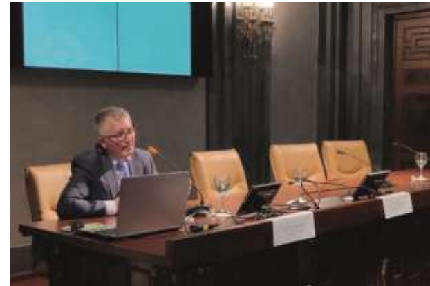
Escanea el código para acceder al vídeo de la conferencia