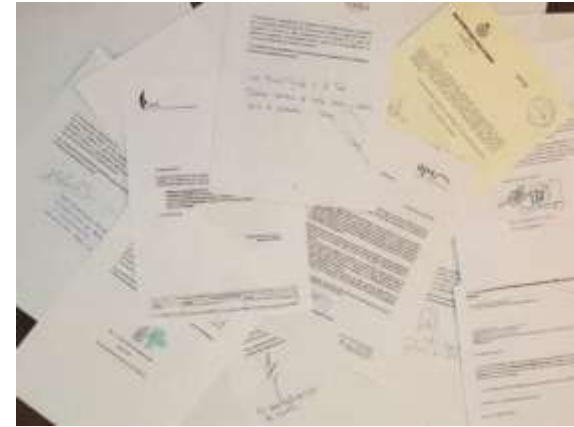
Cartas de distintas instituciones