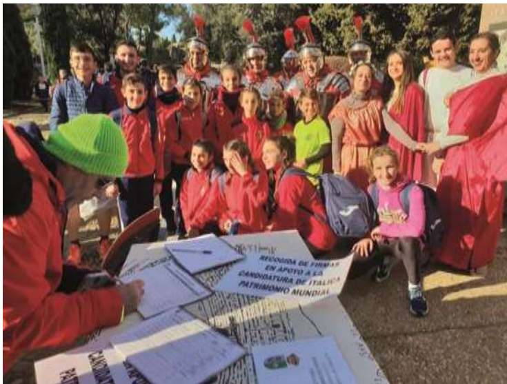
Recogida de firmas por el pueblo de Santiponce