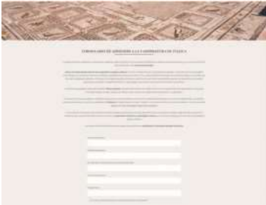
Adhesiones en la web